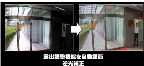
露出調整機能を自動調節 逆光補正